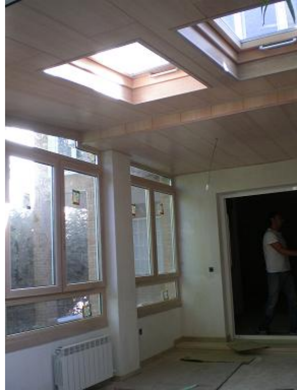
REVESTIMIENTO INTERIOR DE CUBIERTAS EN MADERA NATURAL.