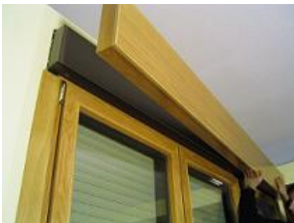
Revestimiento interior del cajon de persiana